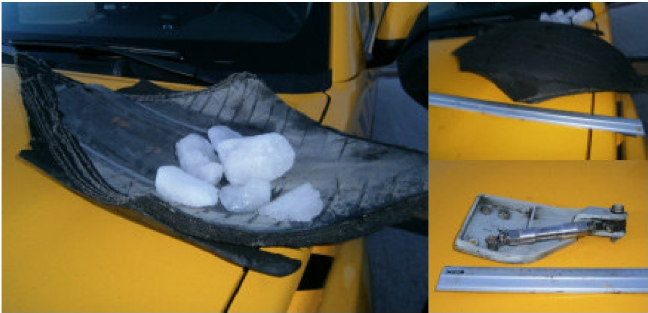
Immagine n.4. Parti dei detriti recuperati sulla pista di atterraggio a Madrid. Per quanto riguarda i blocchi di ghiaccio essi erano nel vano carrello bloccando componenti del funzionamento del carrello stesso e relativo impianto frenante. (pag. 25 del rapporto)

basse temperature incontrate durante la fase di crociera.” (2) Ciò significava che la poltiglia ghiacciata imbarcata nell’alloggiamento durante il decollo si era ancor più solidificata.