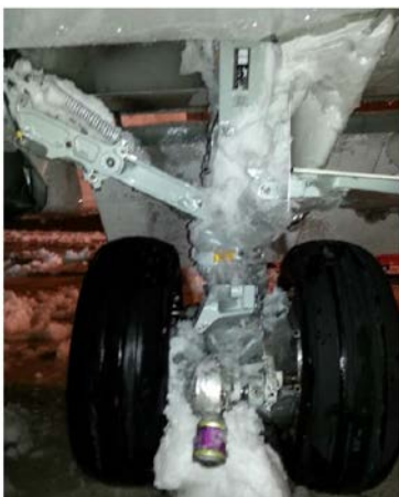
Immagine n.3. Stato del carrello durante la notte della sosta a Pamplona (pag.1 del rapporto)

Infatti è stato appurato che durante la partenza da Pamplona parte della poltiglia di neve che il carrello aveva incontrato durante il taxiing e il successivo rullaggio per il take off era entrata nel vano alloggiamento aderendo alle parti metalliche lì si trovano.