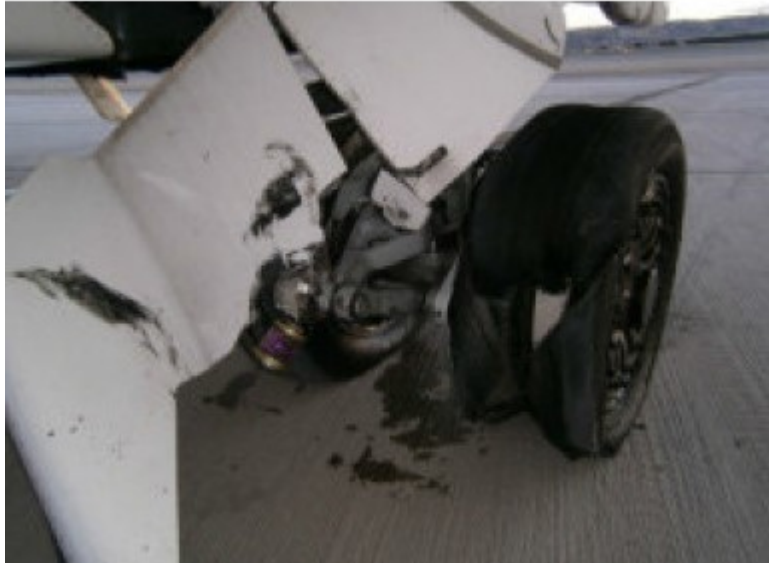
Immagine n.2. Così era ridotta la ruota n. 1 del carrello dopo l'atterraggio a Madrid. (pag.25 del rapporto)

Le indagini presero il via e sono sfociate nel Rapporto investigativo della CIAIAC spagnola(1) reso pubblico il primo giugno 2017.