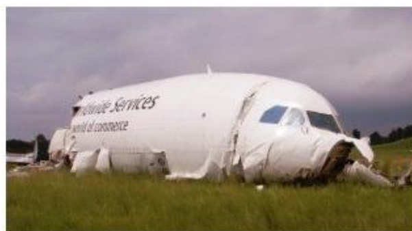
Figure 14. Photograph of the right side of the forward fuselage.

Il luogo dell'incidente all'Airbus UPS, situato a pochi metri dalla testata pista (Immagine tratta alla pagina 8 del rapporto NTSB/AAR 14/02 ; PB2014-107897)