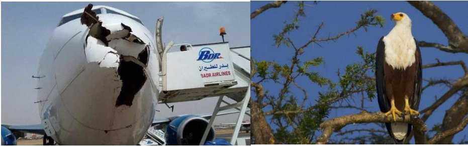
A sinistra: il muso del Boeing dopo l'impatto con l'aquila pescatrice africana nota anche come "falco calvo" il quale può raggiungere un'apertura alare fino 2,4 metri e un peso fino a 3,6 kg (a destra).

A quanto possono ammontare i danni economici per la totalità di questi incidenti siano essi fatali o non?