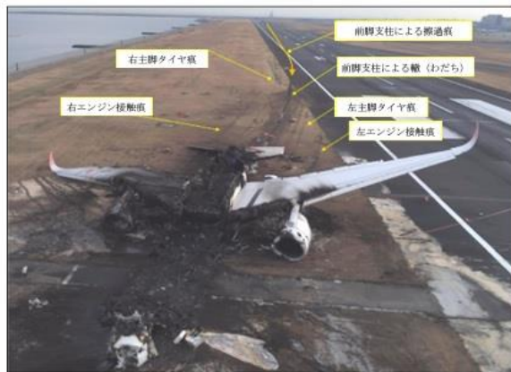
Così è stato ridotto l'A350 dall'incendio (Pag. 60 del Rapporto)

Fra qualche giorno ricorre il primo anniversario dall'incidente. Era proprio il 2 gennaio del 2024 allorché un Airbus A350-900 della JAL Japan Airlines, che effettuava il volo JL-516 da Sapporo a Tokyo Haneda con 367 passeggeri e 12 membri dell'equipaggio, atterrava sulla pista 34R di Haneda alle 17:47L in condizioni notturne, e sulla pista si scontrava con un Dash 8-300 della Guardia Costiera giapponese (1) poco dopo l'atterraggio prendendo fuoco. L'A350 si è fermato sul bordo destro della pista a circa 1680 metri di distanza e tutti gli occupanti hanno potuto evacuare; non vi sono state vittime a bordo dell'aereo di linea. Anche l'altro velivolo, che trasportava 6 persone, prendeva fuoco causando la morte di 5 dei sei occupanti a bordo. Entrambi i velivoli sono stati distrutti dalle fiamme. 15 passeggeri dell'A359 sono rimasti feriti, il capitano del Dash 8 ha riportato gravi ferite. Gli incendi degli aerei sono stati spenti circa 8 ore dopo la collisione.