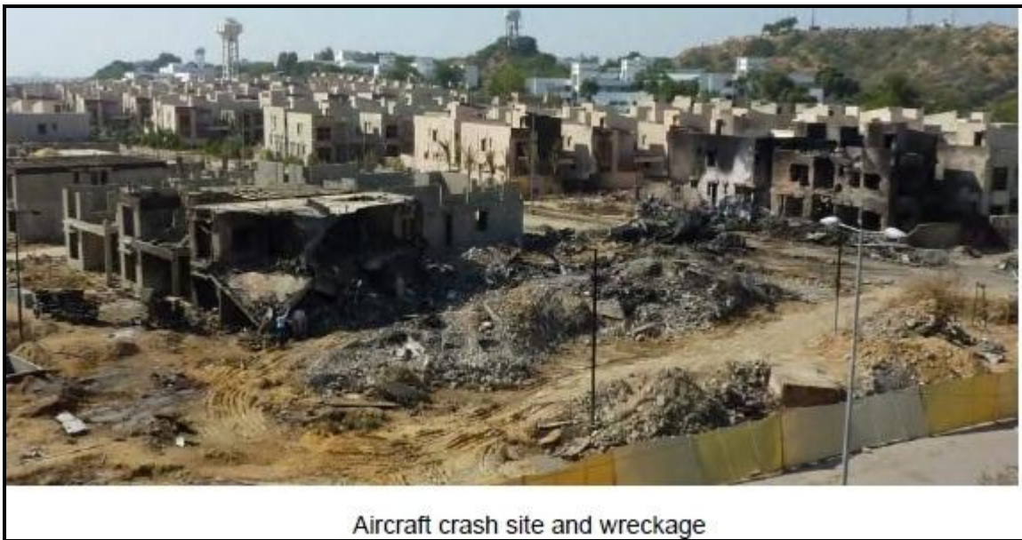
Aircraft crash site and wreckage

27 novembre 2010. Un Ilyushin 76 della compagnia Sunway Air (4L-GNI) decolla dall'aeroporto di Karachi diretto a Khartoum, da qui avrebbe dovuto proseguire per Douala. Si trattava di un servizio cargo che trasportava aiuti umanitari. A bordo solo 8 membri dell'equipaggio, nessun passeggero. L'aereo viene portato sulla testata della 25L e alle 20.48 UTC l'Ilyushin decolla. Secondo le registrazioni radar l'aereo raggiunto i 600 piedi ha iniziato una caduta ed ha impattato il terreno alle 20.50 a una distanza di poche miglia dall'area aeroportuale. Tutti morti i componenti l'equipaggio ed inoltre anche 3 persone a terra abitanti nella zona residenziale ove l'aereo è precipitato hanno perso la vita.