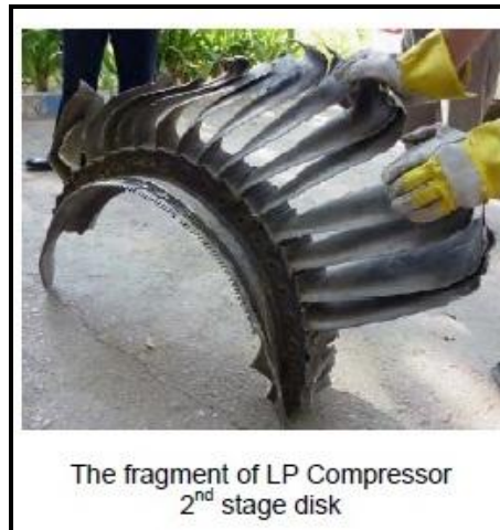
Dalla pagina 29 del Rapporto

The use of mishap engine beyond its manufacturer's assigned life without assessment and life enhancement by the manufacturer was the cause of its uncontained fatigue failure.” (3)