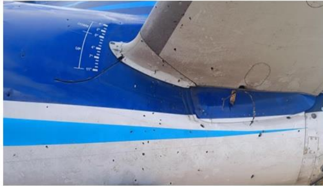
Рис. 10. Повреждения левой стороны хвостовой части