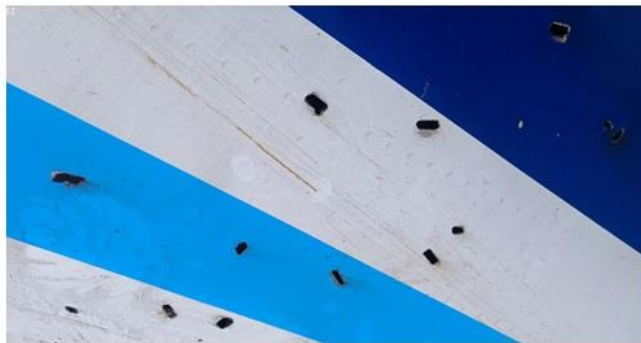
Рис. 11. Повреждения левой стороны хвостовой части

La sciagura di Natale è quindi stata causata da un atto ostile compiuto contro un aeromobile di linea.