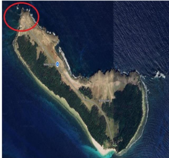
Fig. 2 Mabag Airstrip nella isola di Mabog, Filippine