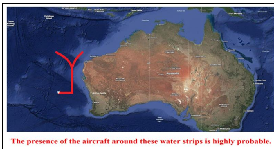
Fig. 1 : La lettera "Y" in rosso evidenzia la possibile area di caduta di MH370

L'entità di questa deviazione dipende dalla stanchezza del pilota, dalle condizioni meteorologiche e dal carico utile dell'aereo. Tuttavia, l'affidamento assoluto delle autorità investigative ai soli dati satellitari e la loro insufficiente attenzione a questo principio fondamentale dell'aviazione hanno portato a un decennio di perplessità per gli investigatori. Questo asse ci conduce nelle acque poco profonde al largo della costa nord-occidentale dell'Australia. La presenza dell'aereo in quella zona è altamente probabile: non si tratta di una supposizione, ma di un'inevitabilità ingegneristica se si seguono i principi fondamentali del volo senza apparecchiature di navigazione. L'aereo ha proseguito la sua rotta verso sud affidandosi esclusivamente alla bussola magnetica montata sul giroscopio per orientarsi, senza alcun altro ausilio di navigazione, al fine di eludere i segnali dei satelliti di rilevamento mentre si dirigeva verso la sua destinazione finale. Inoltre, l'autopilota non è stato utilizzato, poiché questa rotta non era pre-programmata nel computer dell'autopilota, e il software dell'autopilota non risponde al semplice inserimento di "Oceano Indiano centro-meridionale" per modificare la rotta dell'aereo. Anche l'inserimento delle coordinate di un punto sull'oceano richiede una connessione satellitare, che non era presente. Tutto ciò dimostra che l'aereo era pilotato manualmente.