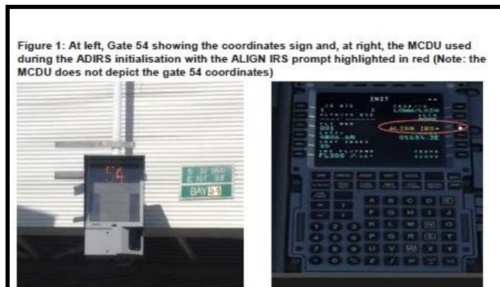
Dalla pagina 2 del rapporto dell'ATSB

In pratica uno sfalsamento di 11.000 chilometri che portava il computer ad assumere che l'aereo si trovasse in prossimità di Cape Town in Sud Africa anziché trovarsi nella terra dei canguri.